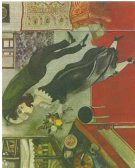
④ Marc Chagall 生日 1923 年