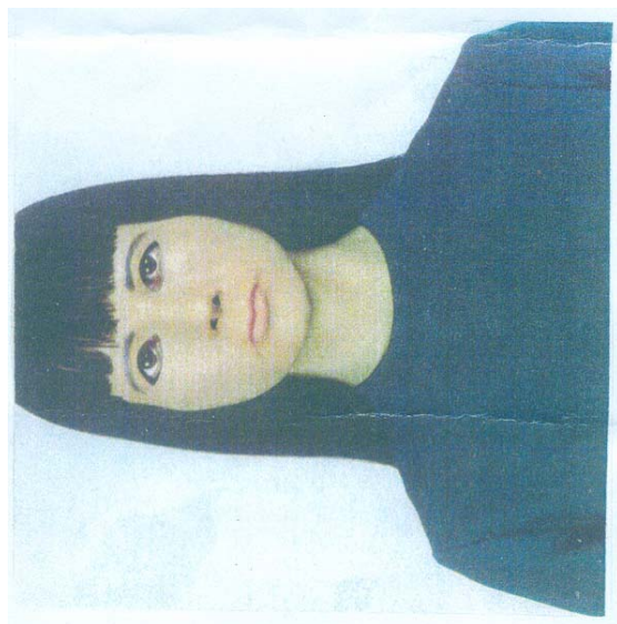
③ Gillian Wearing 影像輸出 2000 年